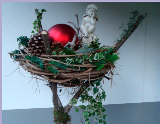
DEKO DREIBEIN | 11.11.