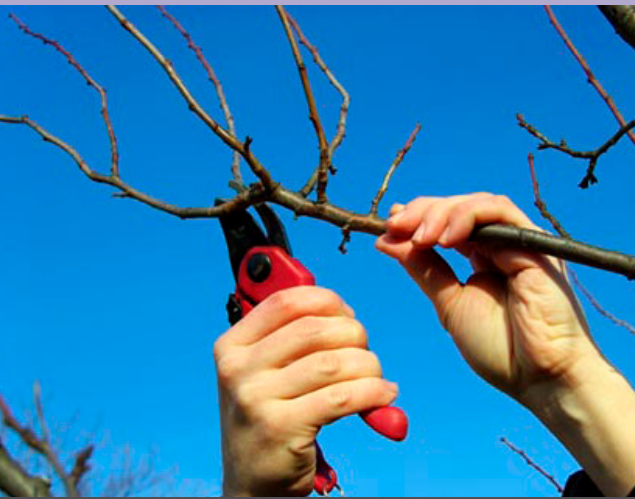
BEEREN- UND OBSTBAUMPFLGE | 28.02.