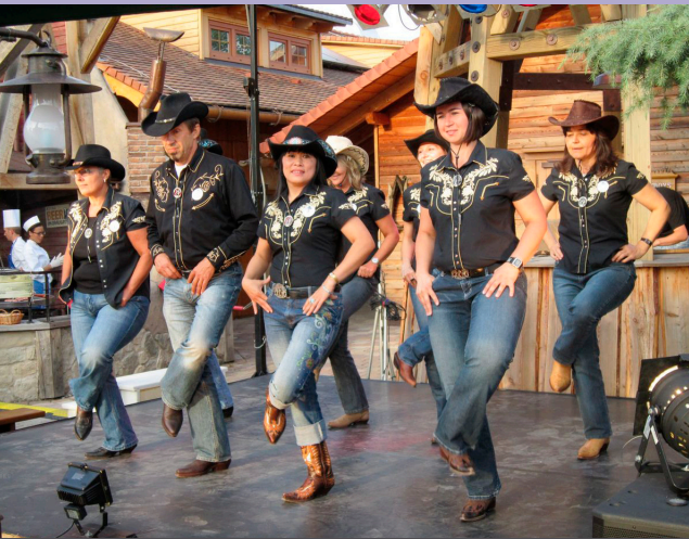
LINE DANCE | AB 26.02.