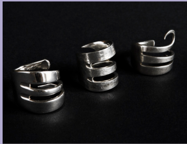
FINGERRING AUS SILBERBESTECK | 21.10.