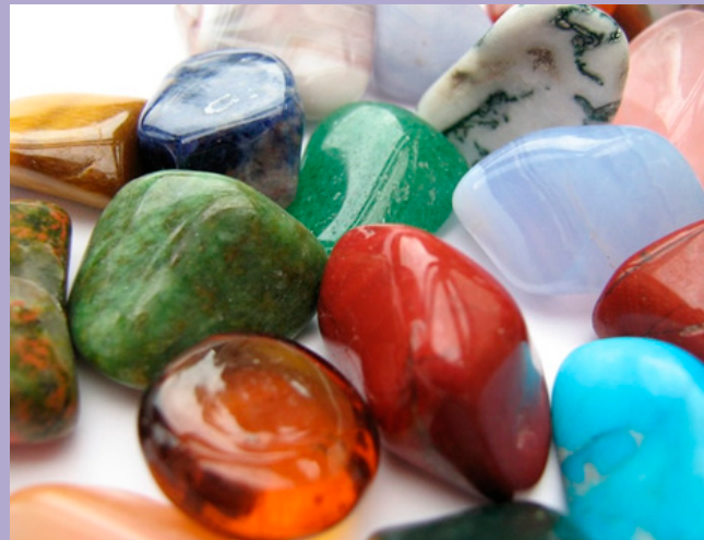
EDELSTEINE FÜR KÖRPER, GEIST UND SEELE