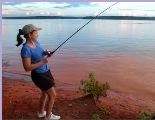
FISCHEN FÜR FRAUEN