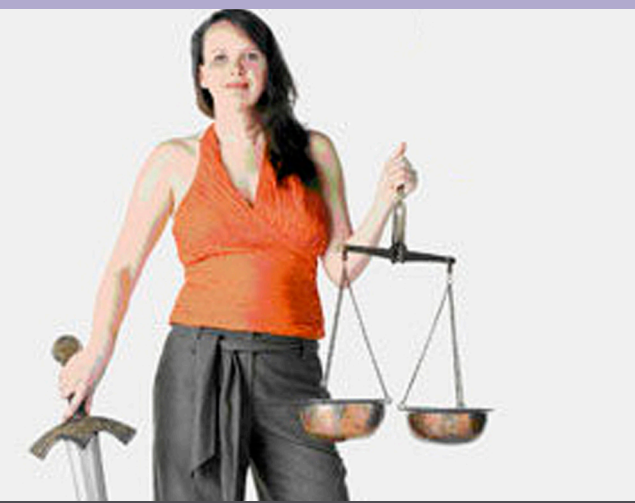
RECHTSFRAGEN IM ALLTAG