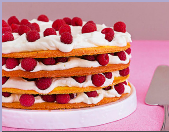
TIPPS ZUM TORTENFÜLLEN | SCHNELLE DESSERT